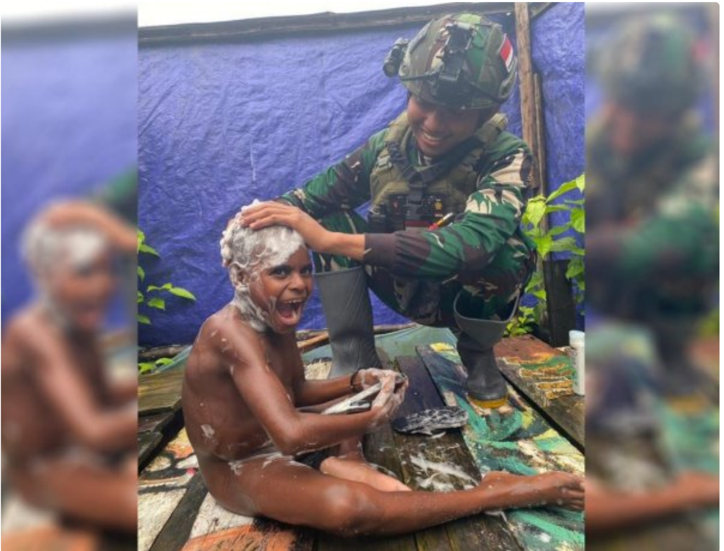
Foto: Saat Satgas Pamtas Mobile RI-PNG Yonif 503/Mayangkara Koops Habema Mengajarkan Anak-anak Menjaga Kebersihan Dengan Mandi Air Bersih di Pos Batas Batu, Kecamatan Batas Batu, Kabupaten Nduga, Papua Pegunungan, Kamis (04/07/2024).

NDUGA- Satgas Pamtas Mobile RI-PNG Yonif 503/Mayangkara Koops Habema